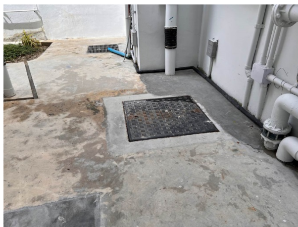
ภาพที่ 2-6 บ่อหน่วงน้ำฝนของโครงการ