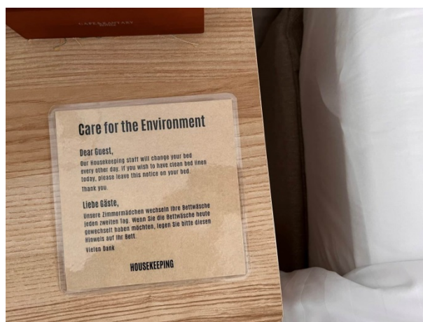
ภาพที่ 2-5 การรณรงค์การประหยัดน้ำ