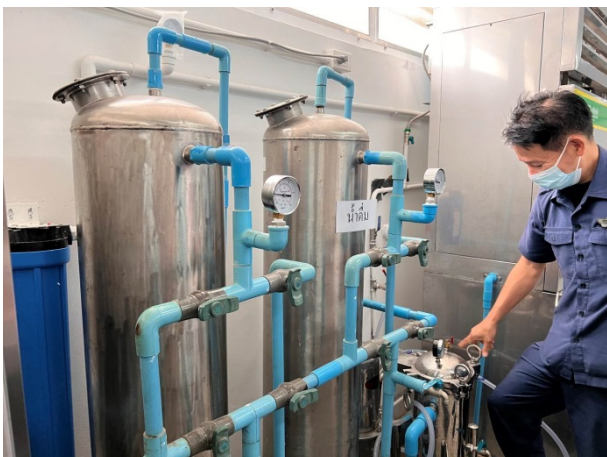
ภาพที่ 2-7 การดูแลระบบสาธารณูปโภคของโครงการ