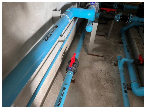
ภาพที่ 2-2 ป้ายแสดงตำแหน่งการเปิด-ปิดวาล์วต่างๆ